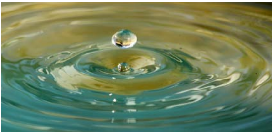
Naciones Unidas aprobó una resolución que reconoce al agua potable y al saneamiento básico como derecho humano esencial para el pleno disfrute de la vida y de todos los derechos de la humanidad.

P ese a los esfuerzos por frenar el deterioro de los páramos, estos ecosistemas siguen en grave peligro debido a factores como la expansión de la frontera agrícola, la ganadería, la minería e, incluso, la propagación de una planta invasora que llegó hace unos 60 años de Europa.