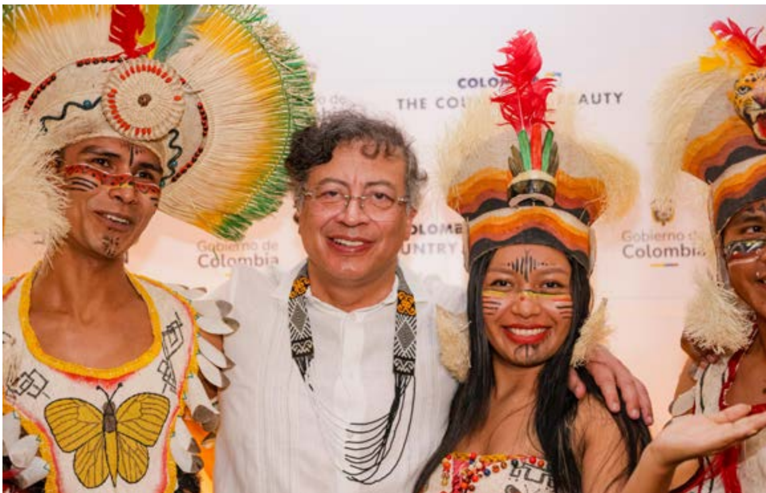
El presidente de los colombianos, Gustavo Petro Urrego, puso a consideración de la ciudadanía la convocatoria de una Asamblea Constituyente.

Descarte de reelección: El presidente busca calmar a la oposición al