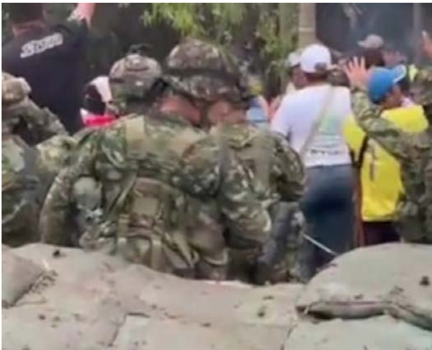
La Defensoría del Pueblo y otros organismos humanitarios han sido llamados a mediar, en una situación que se suma a varios episodios de retención de uniformados en la misma región del Cañón del Micay durante el último año