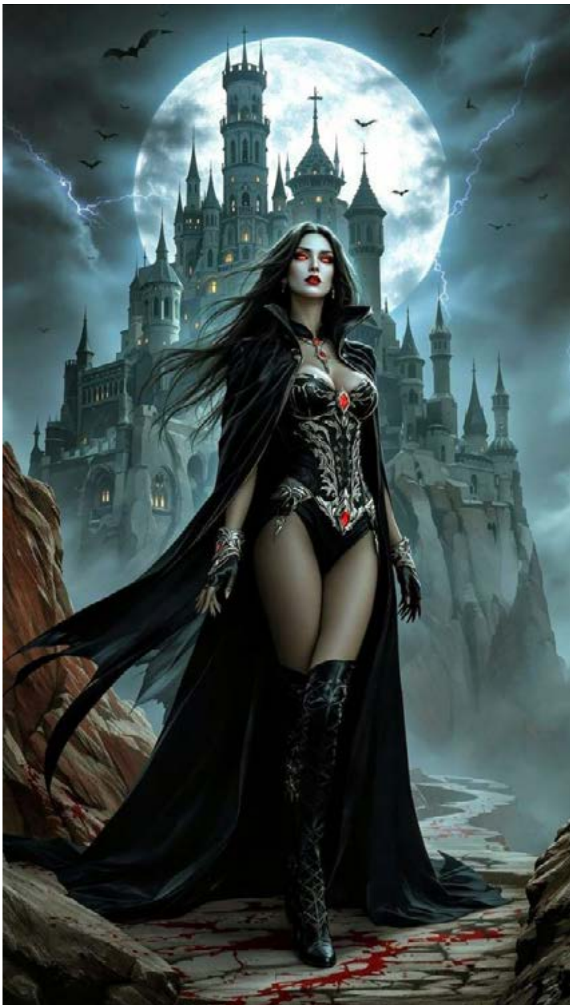
Vampira del futuro

En sus redes sociales, ha compartido momentos de su trayectoria, como la historia de cómo consiguió sus prácticas en Noticias Caracol: «Yo pensé la verdad que no iba a quedar, fui a la entre-