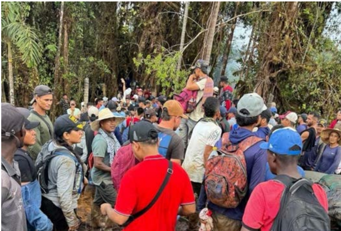
Según el Ejército, la retención de los 72 uniformados —entre ellos 3 oficiales y 4 suboficiales— es una táctica recurrente de los grupos armados ilegales.

El gobernador del Cauca, Jorge Octavio Guzmán Gutiérrez, brilló por su ausencia.