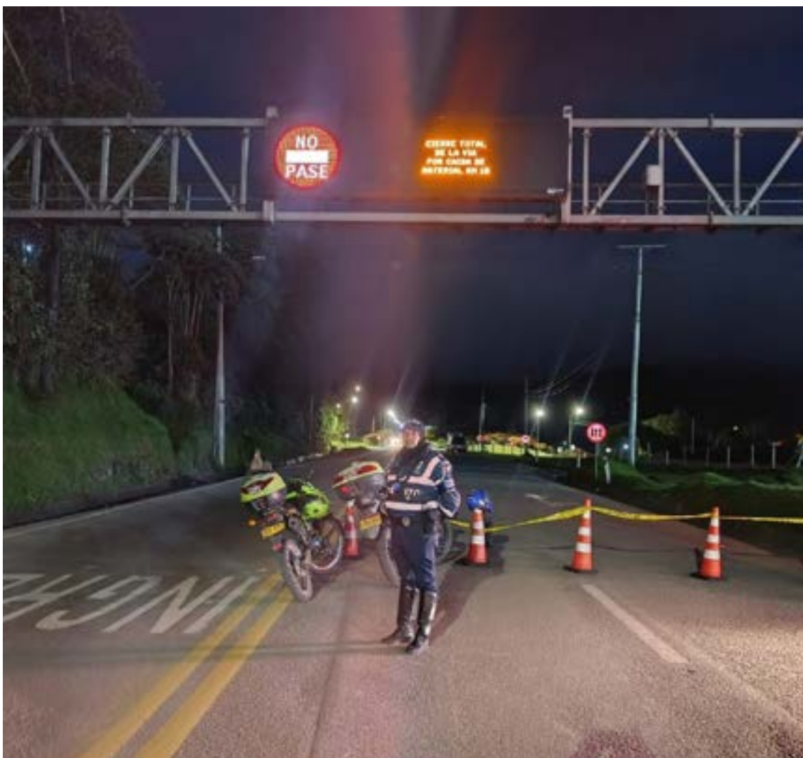
Ante el prolongado cierre, las autoridades han pedido a los conductores posponer sus viajes o utilizar las vías alternas disponibles, que, aunque implican un aumento en el tiempo de desplazamiento.

Las intensas lluvias de la temporada han sido la causa del colapso del terreno, pero la complejidad del fenómeno ha frustrado las labores de remoción. La concesionaria Coviandina ha descrito el hecho como un