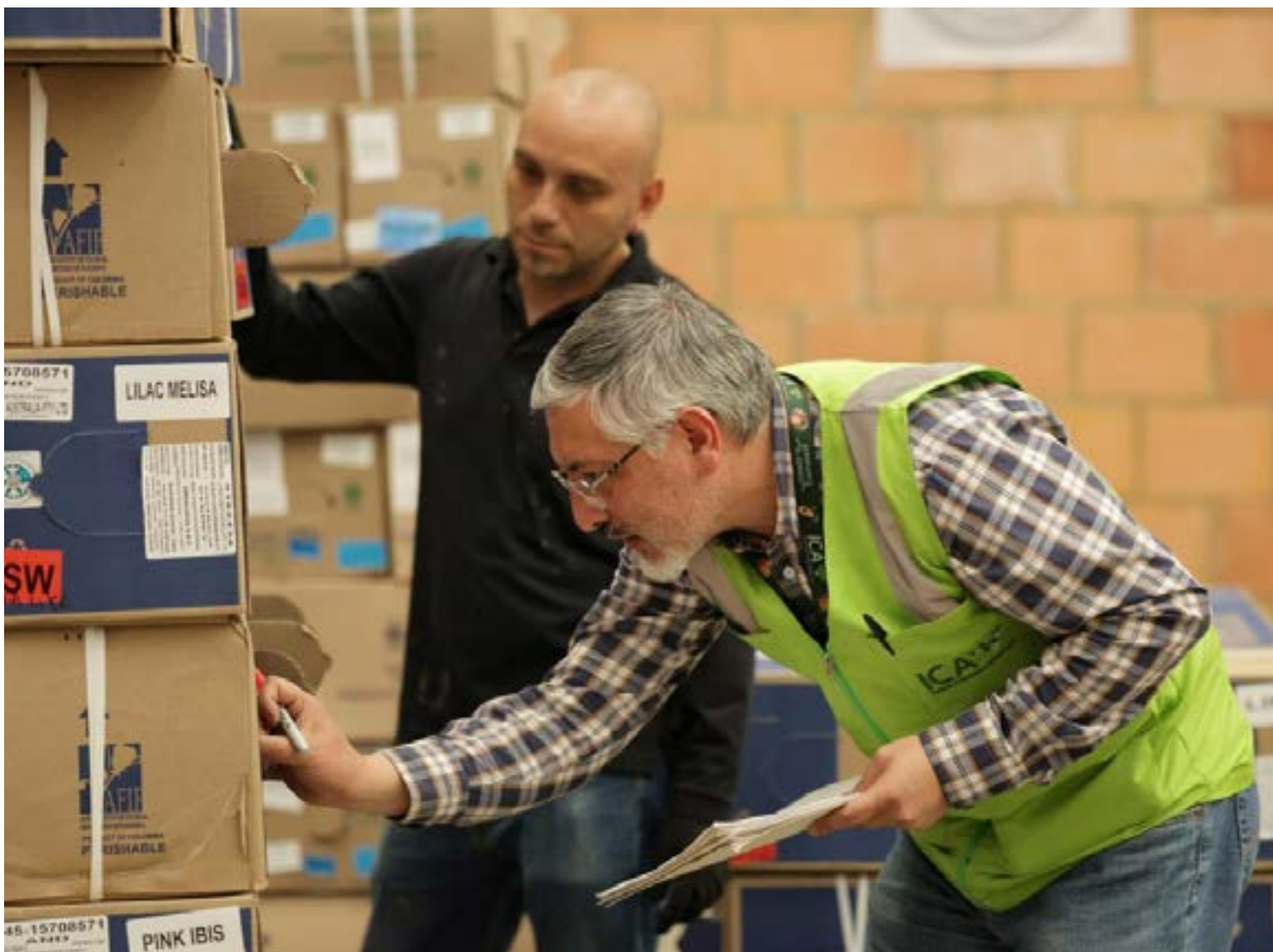
La iniciativa no solo optimiza la logística, sino que también genera beneficios directos para los exportadores.

El éxito de este modelo ha impulsado su expansión a otros sectores. Actualmente, el ICA también realiza inspecciones en origen en 35 plantas de aguacate Hass y tres empresas que exportan arándanos y cítricos. Se espera que el programa se extienda a otros productos frescos como la uchuva, gulupa, banano y plátano, potenciando aún más el desarrollo económico y la capacidad técnica de los exportadores colombianos.