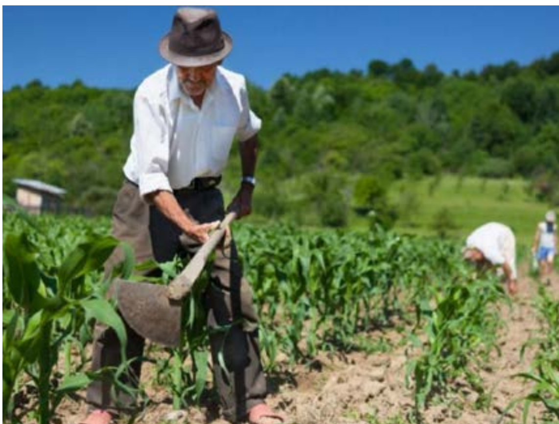
La Corte enfatizó que los concursos para cargos de jueces y magistrados de esta nueva jurisdicción deben evaluar el conocimiento sobre los derechos de las comunidades campesinas, asegurando que las decisiones se tomen con un enfoque diferencial, territorial y de género.

La creación de esta jurisdicción es un avance fundamental en la implementación del Acuerdo Final de Paz, particularmente en lo que respecta a la Reforma Rural Integral. Con la puesta en marcha de esta ley, se instalarán jueces y tribunales espe-