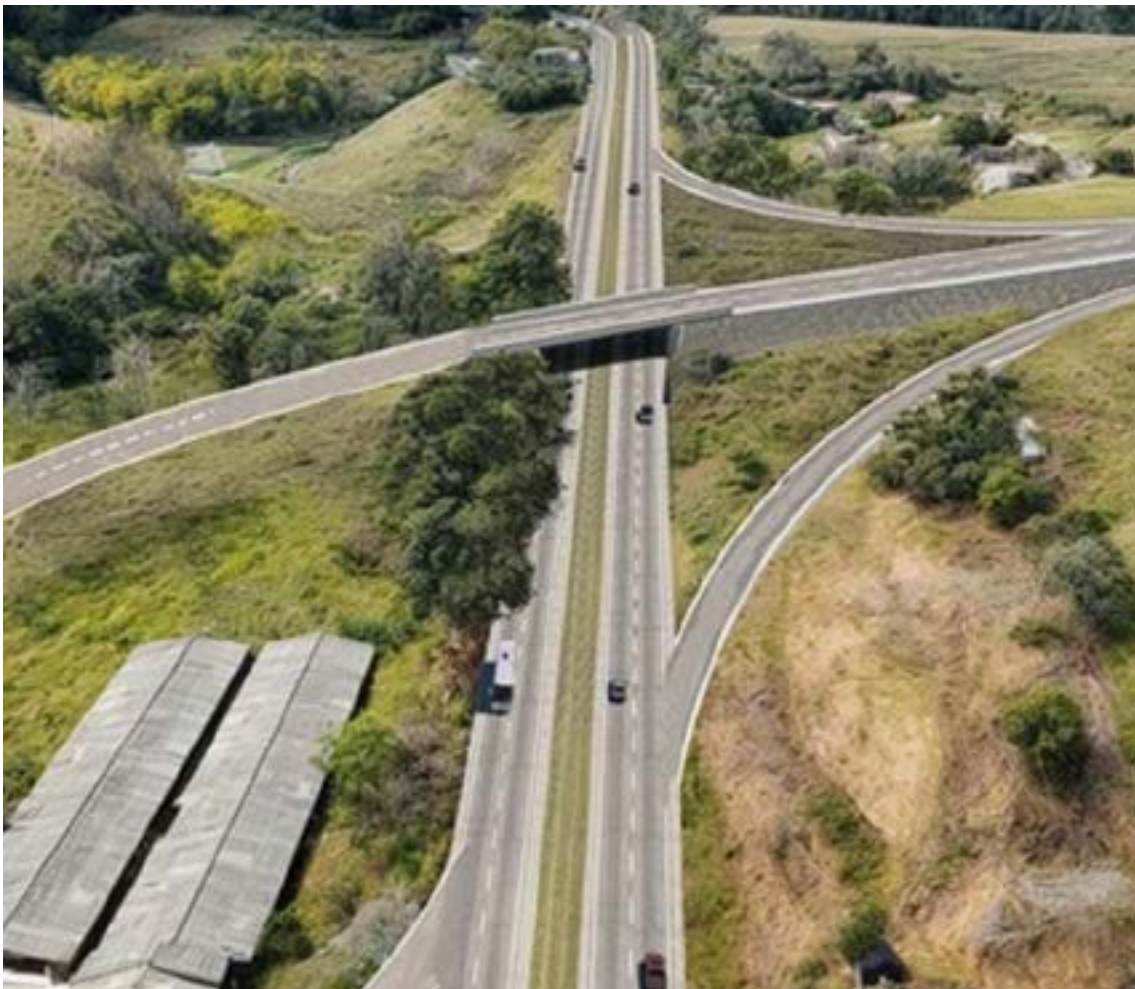
El ambicioso proyecto de iniciativa pública El Estanquillo – Popayán. Con una inversión proyectada de $8,82 billones de pesos.

125 puentes vehiculares y 15 puentes peatonales.