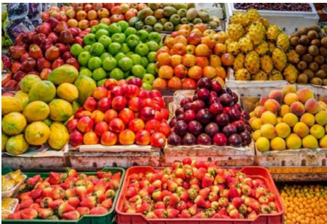
Las frutas son un renglón importante en las exportaciones de Colombia

La iniciativa no solo optimiza la logística, sino que también genera beneficios directos para los exportadores. Hasta la fecha, 12 empresas y 13 centros de producción en Cundinamarca y Antioquia se han beneficiado de un proceso de exportación más eficiente, seguro y económico. Este enfoque reafirma el compromiso de Colombia con la excelencia y la traza-