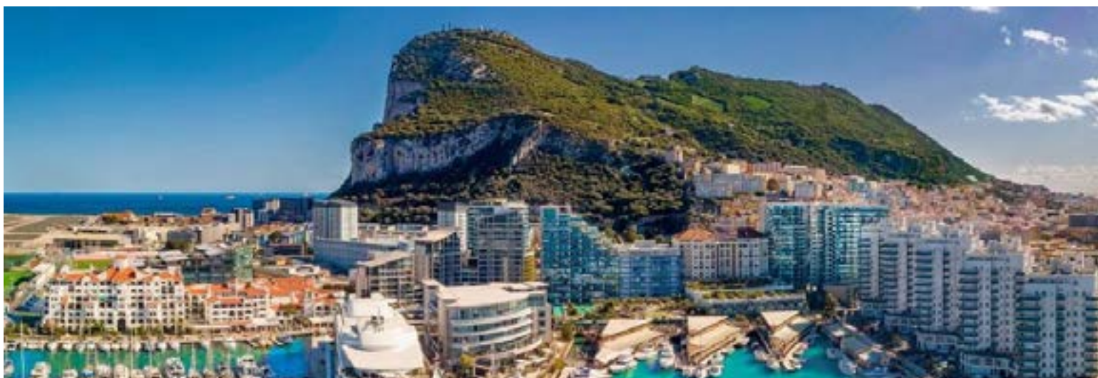
Una plataforma de vidrio transparente suspendida sobre el precipicio del Gran Cañón, que ofrece vistas panorámicas únicas.

No se había terminado la Segunda Guerra Mundial cuando Pérez-Reverte escoge este canal natural -de por sí paradisíaco- para narrar las operaciones de espionaje entre británicos e italianos con el fin de prolongar y hacer más mortífera la Segunda Guerra. En esta oportunidad, las aguas del Mediterráneo son la base para que los soldados europeos se conviertan en un grupo de buzos expertos que buscan eliminarse entre sí. Es interesante que todo estrecho creado por la naturaleza -como Alaska, Kerch, Gibraltar y El Bósforo-, además de ser centros de inspiración para crear películas o libros de acción, o para servir de entretenimiento, sean las mejores herramientas para proteger el medio ambiente circundante y constituirse en banderas ejemplares de la paz.