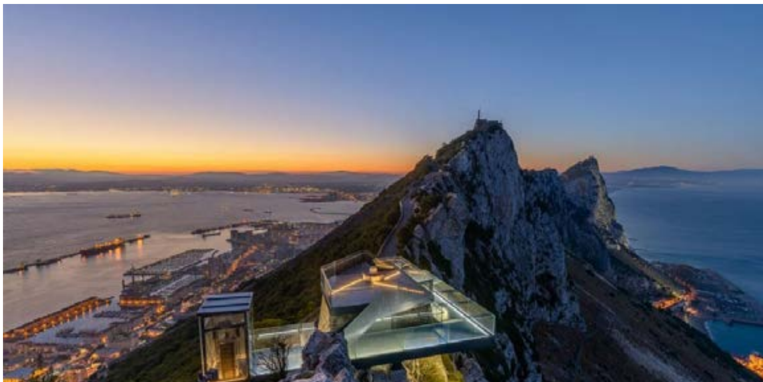
Una plataforma de vidrio transparente suspendida sobre el precipicio del Gran Cañón, que ofrece vistas panorámicas únicas.

hasta esa pata curva del mundo; la pata que luego se conocería como el sur de Argentina. Su hallazgo le permitiría cruzar el estrecho y toparse con un mar de aguas tranquilas que llamaría el Mar del Pacífico.