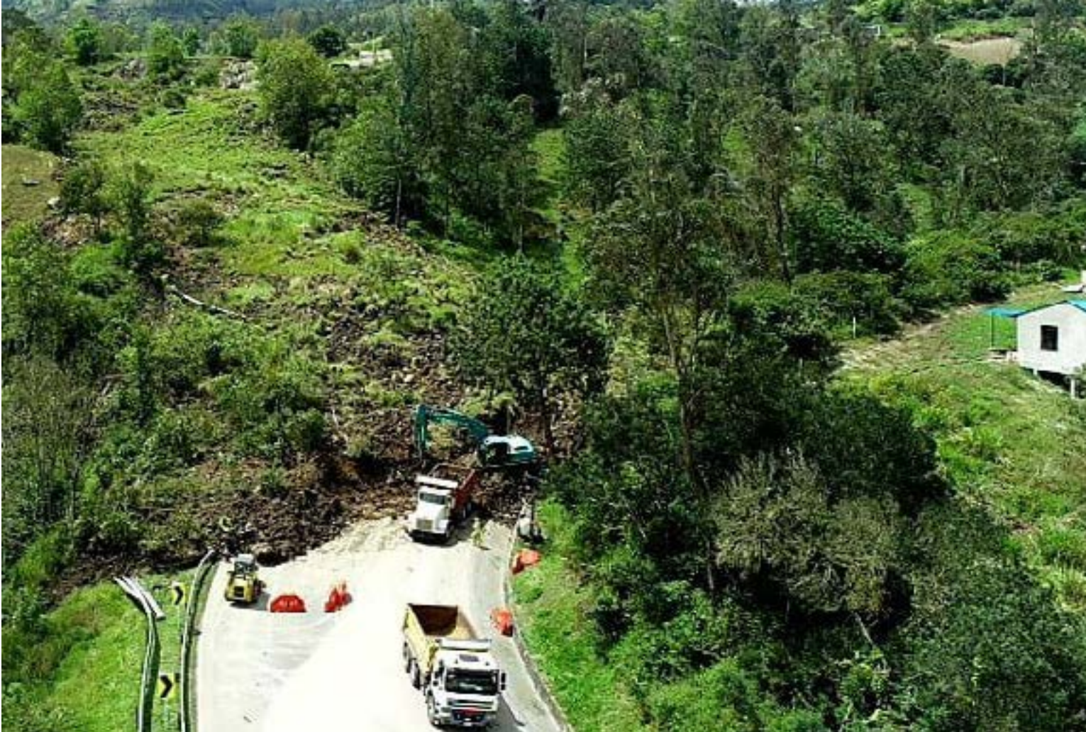
Las intensas lluvias de la temporada han sido la causa del colapso del terreno, pero la complejidad del fenómeno ha frustrado las labores de remoción.